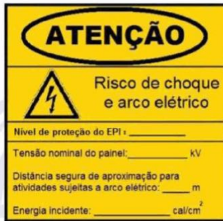
Figura D.2 – Exemplo de placa de segurança – Risco de choque e arco elétrico