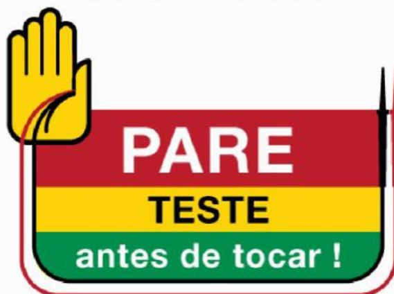
Figura D.3 – Exemplo de placa de segurança – Teste antes de tocar