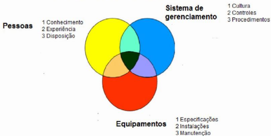
Figura D.1 – Pilares da cultura da segurança elétrica

É recomendado que seja praticado pelo líder e percebido e praticado pelas equipes. Necessita de envolvimento ativo das equipes de segurança elétrica, corporativa e local. A empresa precisa definir seus princípios e estabelecer um programa permanente de segurança elétrica.